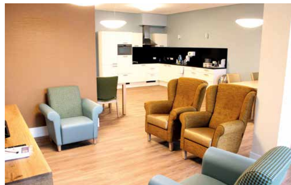
Gezamenlijke woonkamer woongroep.