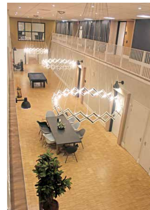
Middengebied van bovenaf.

grotere overspanningen aan, en draagt zo bij aan de flexibiliteit van het gebouw."