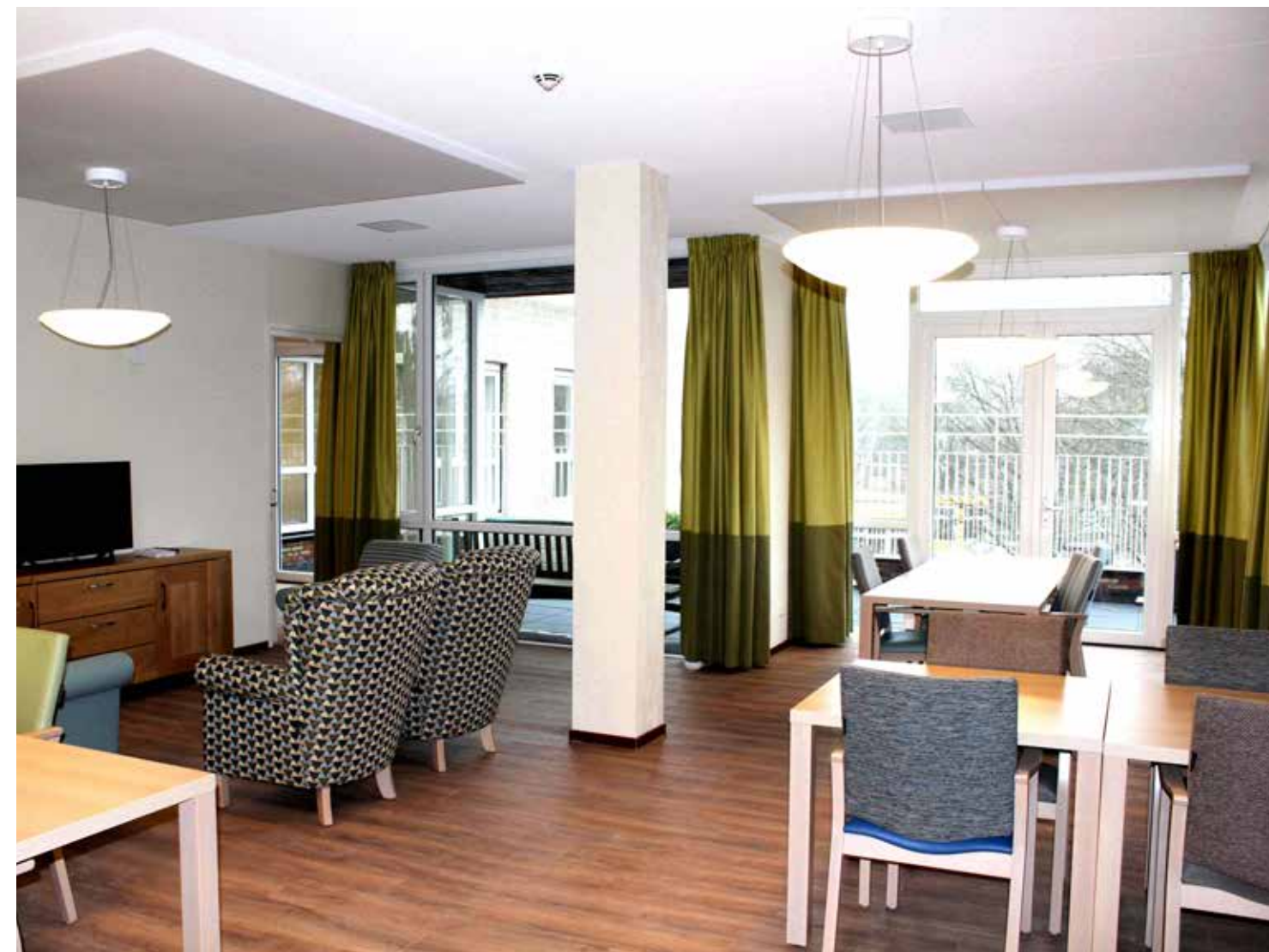
Interieur gezamenlijke woonkamer.